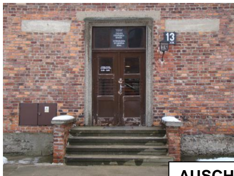
AUSCHWITZ 1 Block 13

Armand BERNHEIM fut d'abord conduit à la Maison centrale de la Maladrerie à Caen puis les Allemands l'emmèrent au "petit lycée" où étaient rassemblés les otages. . Il fut alors envoyé le 4 mai 1942 au camp de Royallieu à Compiègne. Il partit dans le convoi dit des "45 000" du 6 juillet 1942. Le 8 juillet 1942, Armand Bernheim fut enregistré au camp souche d'Auschwitz (Auschwitz-I) sous le numéro 46 268. Après l'enregistrement, il fut entassé avec les 1 170 arrivants de son convoi dans deux pièces nues du Block 13 où il passa la nuit avant de rejoindre Auschwitz-Birkenau le lendemain. Le 10 juillet, il fut envoyé au travail dans un Kommando. Le 13 juillet 1942, après l'appel du soir, la moitié des membres du convoi est ramenée au camp principal (Auschwitz-I). Aucun document ni témoignage ne permet de préciser dans lequel des deux sous-camps du complexe concentrationnaire nazi a été affecté Armand Bernheim. Armand Bernheim mourut à Auschwitz le 15 août 1942, selon l'acte de décès établi par l'administration SS du camp.